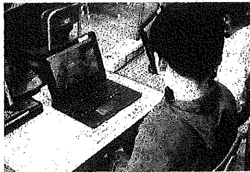
【友達の動画を観ながら真似をする様子】